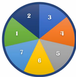
Figura 1: Roleta de Números