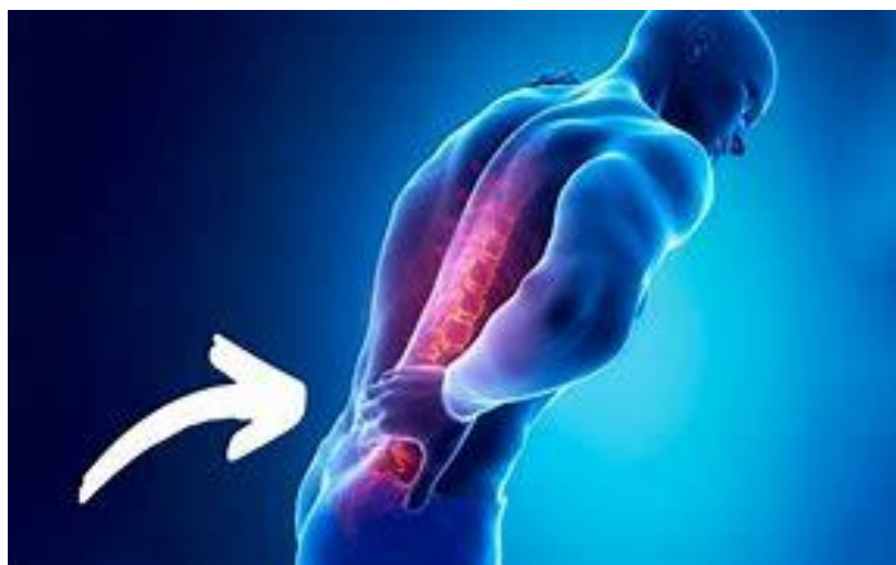
Figura 2: Homem com dor na coluna

Portanto, todos esses efeitos diminuem a produtividade do funcionário, prejudicando a empresa, como também ao trabalhador, com o intuito de uma vitória mútua, será apresentado uma melhoria para esse cenário.