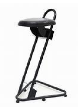
Figura 4 – Banco Ergonômico

Além disso, os bancos ergonômicos servem para diminuir a carga de trabalho em pé, para atividades que não apresentam necessidade de tal, com encosto para o funcionário, é possível executar as tarefas de forma eficiente e confortável, e chegando ao final do expediente com maior disposição, gerando uma maior produtividade para o empregador, e uma maior qualidade de vida para o empregado.